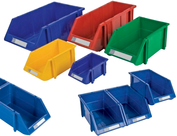
Pièces moulées pour faciliter l'assemblage côte à côte