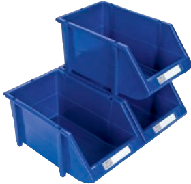
Empilables avec les pieds intégrés