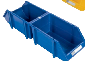
Une agrafe d'assemblage permet un montage dos à dos