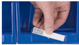
Plaque avant inclinée avec étiquette amovible recouverte de plastique protecteur