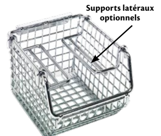
Supports latéraux optionnels